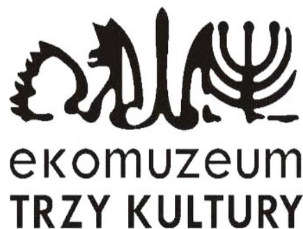
Ryc. 2. Logo ekomuzeum „Trzy Kultury”.