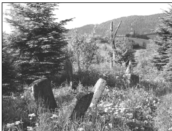
Fot. 2. Ruiny synagogi i kirkut w Lutowiskach.