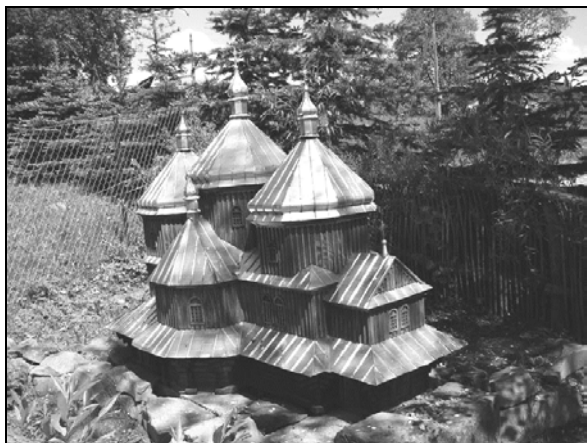
Fot. 3. Makieta cerkwi z Lutowisk.

Cmentarz greckokatolicki położony jest na południe od cerkwi. Założony na przełomie XVIII i XIX w. Do II wojny światowej użytkowany był przez wyznawców obu wyznań. Zachowały się tutaj nagrobki z inskrypcjami polskimi i ukraińskimi. Najstarsze z nich pochodzą z lat 60. XIX w. Odnowiony i uporządkowany został w roku 1988 (fot. 4). (Bieszczady. Słownik..., 1995).