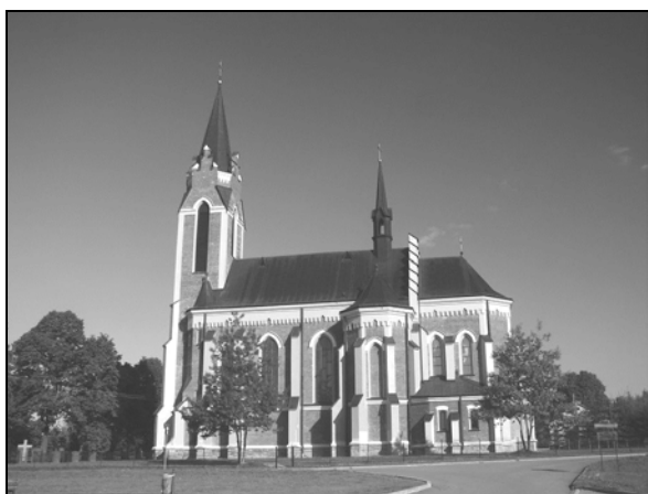
Fot. 1. Kościół pw. św. Stanisława Biskupa w Lutowiskach.

On też sprawował nadzór nad budową świątyni, którą zakończono w latach 20. XX w. Neogotycki ołtarz główny powstał w Szkole Rzeźbiarskiej Księży Salezjanów w Oświęcimiu. W roku 1938 parafia liczyła 683 wiernych, z czego 185 mieszkało w Lutowiskach. W skład parafii wchodziły ponadto Berehy Górne, Bereżki, Caryńskie, Chmiel, Dwernik, Dydiowa, Hulskie, Krywe, Krywka, Nasiczne, Pszczeliny, Procisne, Ruskie, Skorodne, Smolnik, Stuposiany, Tworylne, Ustrzyki Górne, Wołosate, Zatwarnica, Żurawin. Do 1939 r. kościół został całkowicie wyposażony. Msze w świątyni były odprawiano do 1944 r., do czasu gdy ostatni Polacy opuścili miasteczko. W latach 1944-1951, gdy Lutowiska należały do ZSRR, kościół został całkowicie zdewastowany (zniszczono ołtarz, powyrywano ławki, podłogi, rozkradziono część więzby dachowej, dach podziurawiono kulami). Budynek kościoła wykorzystywany był jako stajnia dla koni. Świątynia ponownie zaczęła służyć wiernym dopiero w 1963 r.