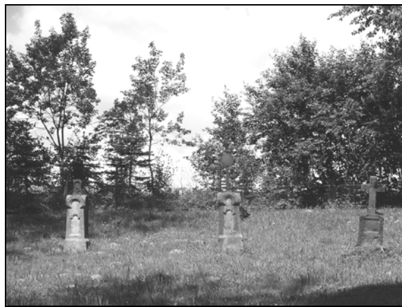
Fot. 4. Cmentarz greckokatolicki w Lutowiskach.

Photo 3. Model of the Orthodox church from Lutowiska.